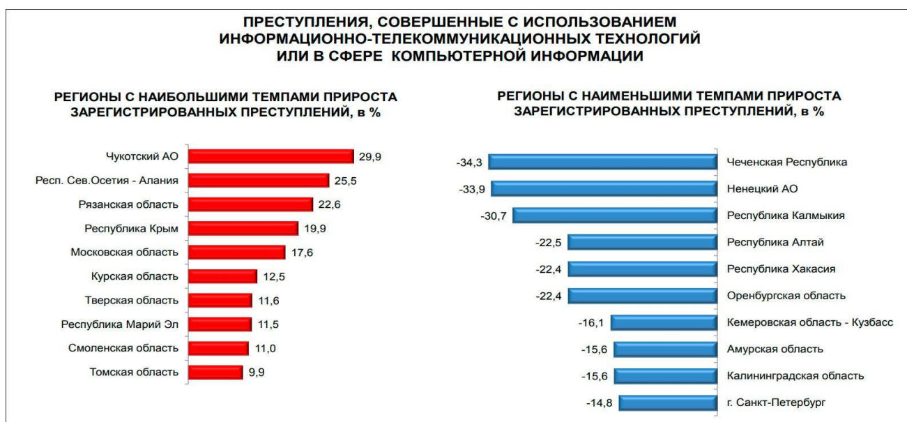
Рисунок 1. Анализ статистических данных о киберпреступлениях в России за последние годы

Таким образом, статистические данные явно указывают на серьезность проблемы киберпреступности в России и необходимость разработки эффективных стратегий по ее противодействию.