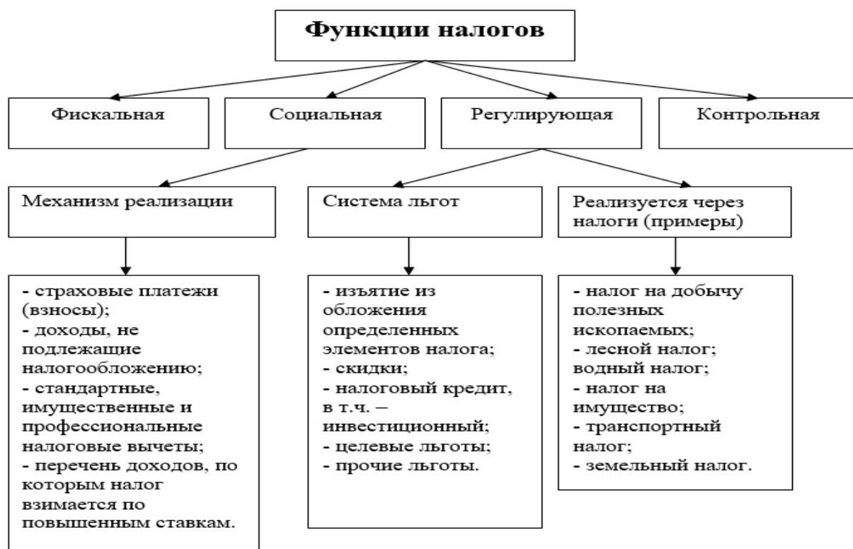
Рисунок 1 – Функции налогов

Определение оптимальной налоговой системы является ключевым аспектом не только на старте бизнеса, но и в ходе его развития, поскольку изменения в бизнес-среде могут предоставить шанс для перехода на более выгодный налоговый режим. Такой выбор может существенно повлиять на доходность, эффективность управления и общую прибыль предприятия. Анализируя различные варианты режимов налогообложения, предприниматель имеет возможность найти наиболее подходящую модель для своего бизнеса [5].