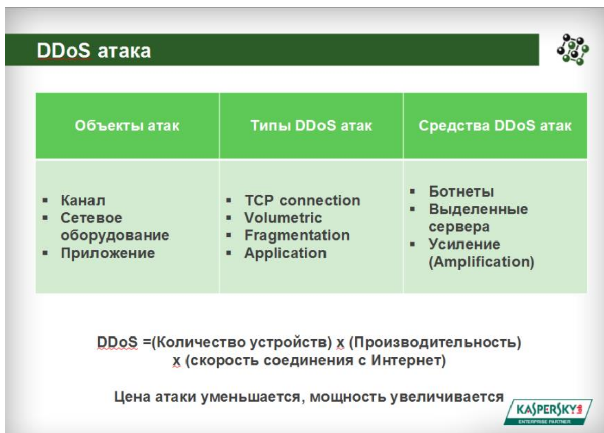
Рисунок 2. Сравнение подходов к борьбе с киберпреступлениями в России и Германии

Киберпреступность в России и Германии являются серьезной проблемой, требующей комплексного подхода к борьбе с ней.